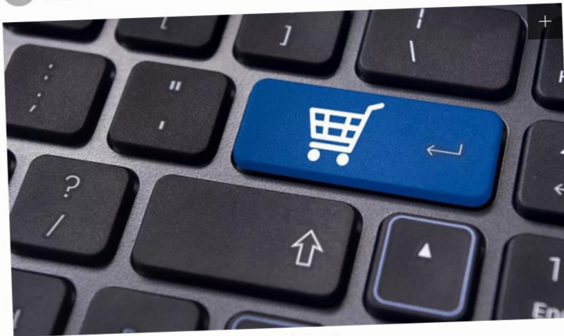
Ilustrasi e-Commerce, eCommerce, Online Marketplace, Bisnis Online

Liputan6.com, Bandung - Indonesia merupakan negara dengan pertumbuhan e-Commerce tertinggi di dunia. Beberapa tahun terakhir, makin banyak pelaku usaha, baik perusahaan besar maupun ritel, beralih atau mengembangkan usaha ke arah digital.