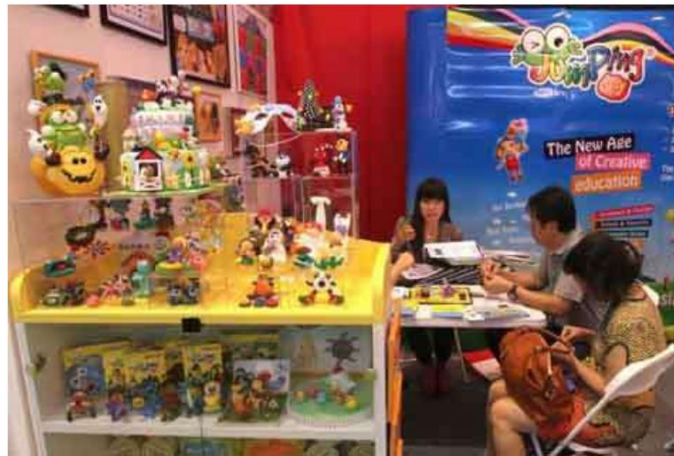
Ilustrasi. - .

Bisnis.com, JAKARTA – Pelaku bisnis waralaba di Indonesia berharap industri dapat lebih berkembang setelah revisi regulasi terkait bisnis waralaba dikeluarkan oleh pemerintah.